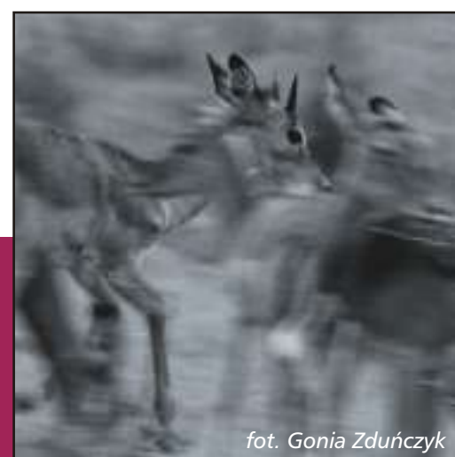
fot. Gonia Zduńczyk